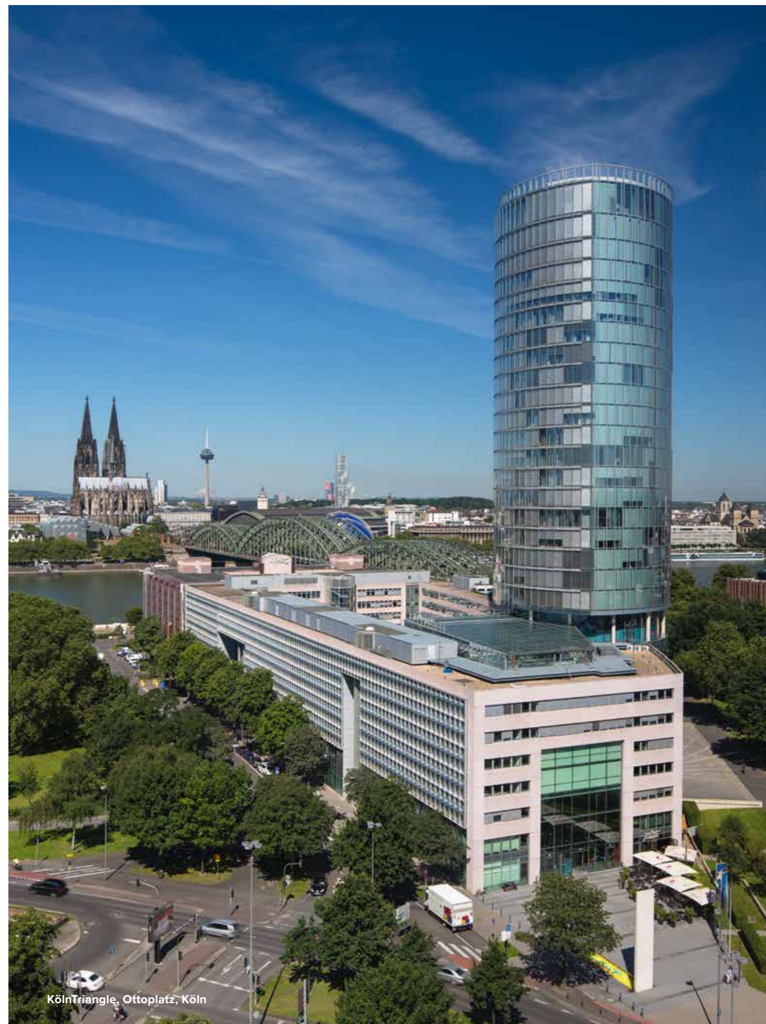
KölnTriangle, Ottoplatz, Köln