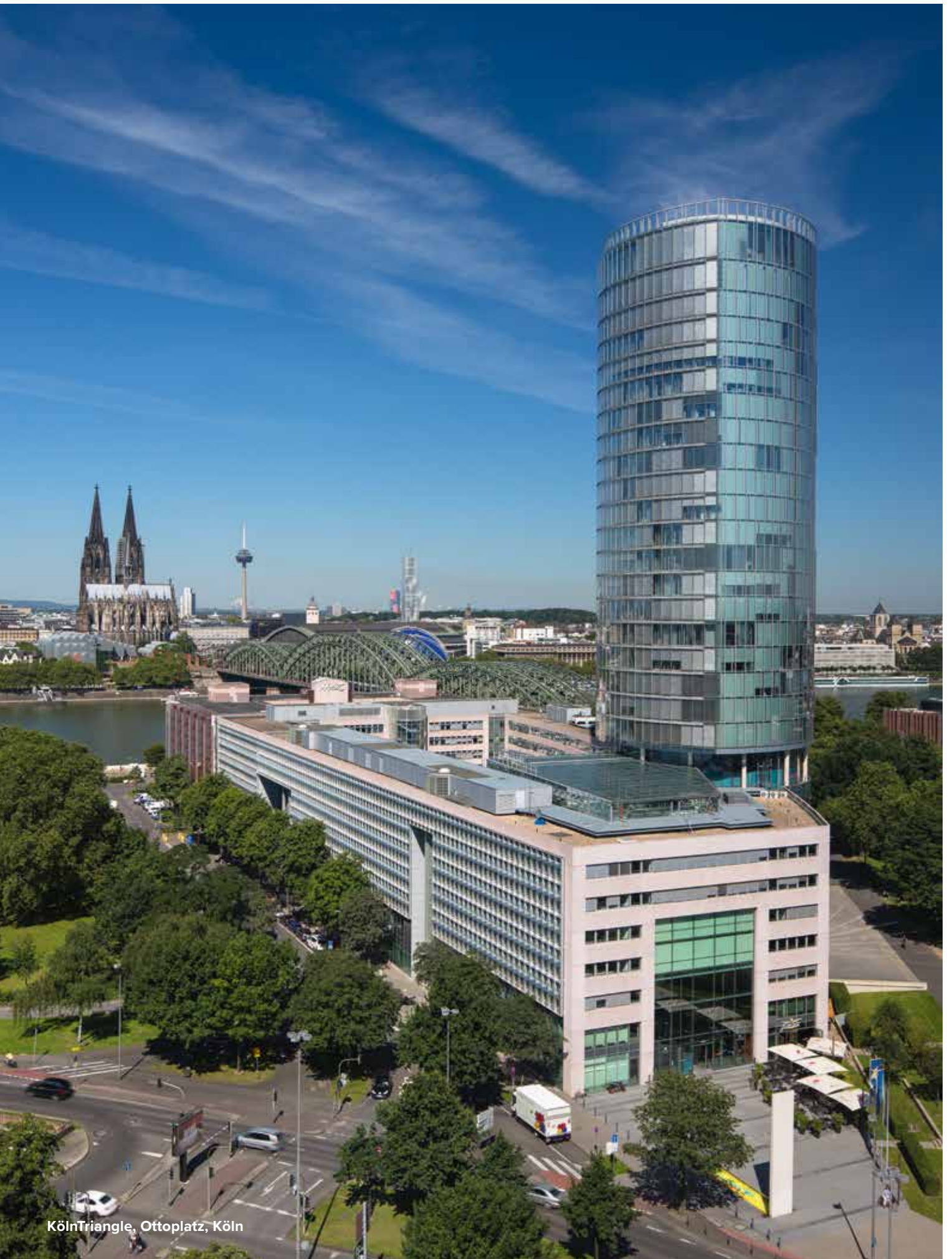
KölnTriangle, Ottoplatz, Köln