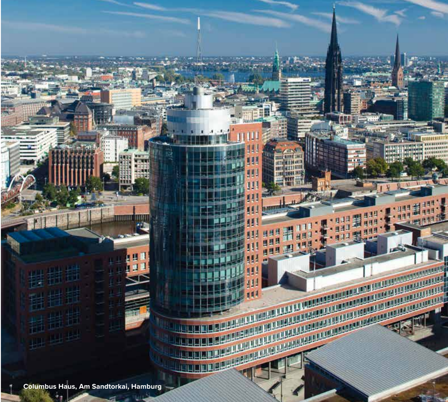
Columbus Haus, Am Sandtorkai, Hamburg

„Mit einem klar strukturierten, marktorientierten Prozess erreichen wir die optimale Positionierung Ihrer Immobilie im Wettbewerb.“